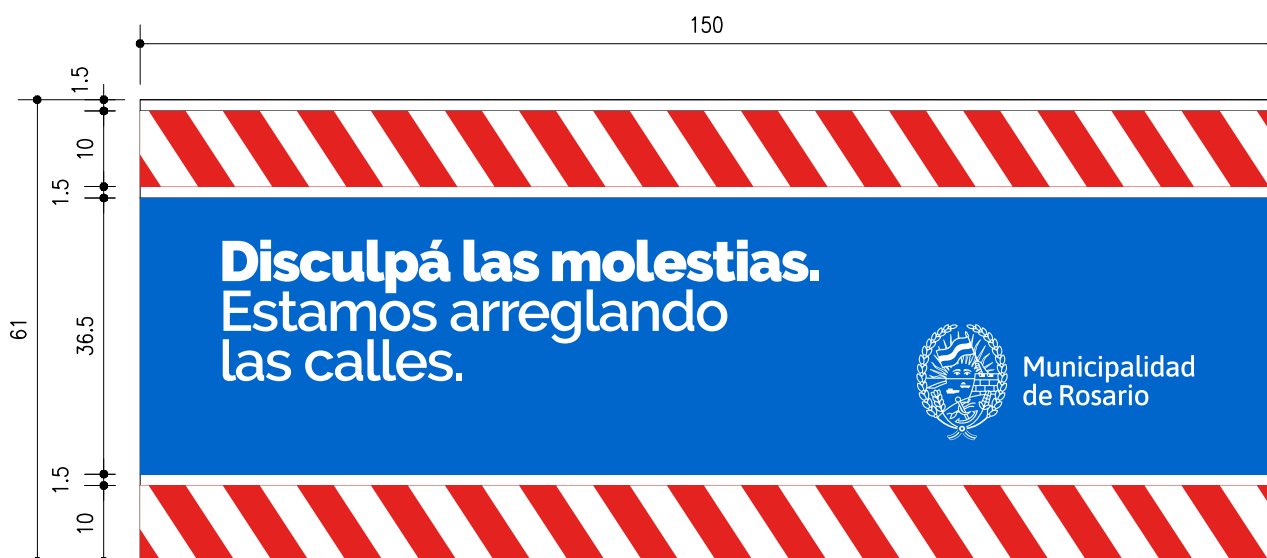
CARTEL DE CHAPA ROTULADO ESCALA:1:10